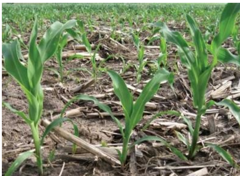
Figura 3. Emergenza irregolare