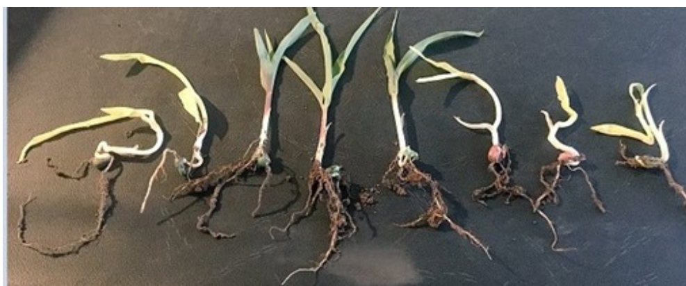
Figura 2. Suoli freddi oppure con temperature disformi durante il processo di germinazione possono causare la deformazione del mesocotile che può manifestarsi nella forma a "cavatappi".

E' possibile che si manifestino lesioni se l'imbibizione (idratazione del seme da 24 a 36 ore successive alla semina) avviene con l'assorbimento di acqua fredda. (Figura 2.)