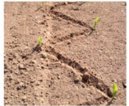
Semina a file binate